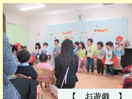
【 お遊戯 】