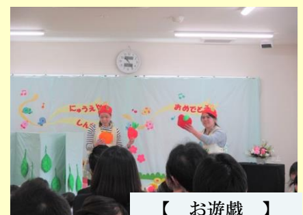
【 お遊戯 】

認可保育園へ移行して5回目の【入園式】が開かれ、新入園児とその保護者が来園しました。今年度は0歳児3名、1歳児9名、2歳児13名、3歳児12名、4歳児12名、5歳児9名、合計58名のスタートです。