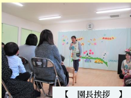
【 園長挨拶 】