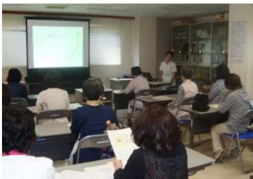
～認知症についての講義風景～

6月2日（木）若葉台地区保健活動推進員15名の方が横浜ほうゆう病院にいらっしゃいました。一緒に認知症について学び、地域での事例等の共有を行いました。