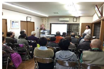
岸本自治会館にて

平成27年12月10日(木) 弥生会・岸本自治会・笹野台地域ケアプラザ共催、「認知症予防と対応のコツ」について出張講座に行ってきました。内容は認知症の病気の理解や予防方法について、またどのように医療機関を受診したらよいか、準備方法についてお話しをさせていただきました。 ※出張講座承ります。