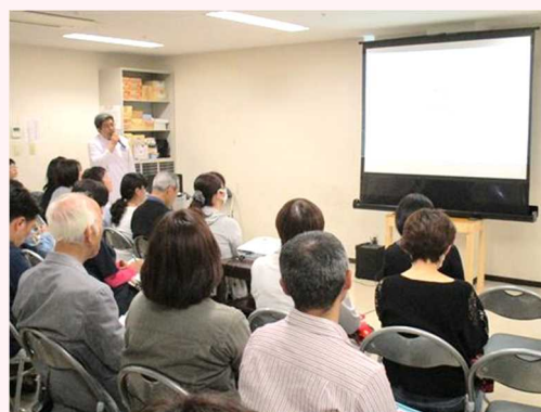
<前半の部> 講演会 の風景

今回いただいたご家族様のお声をデイケア・サンアリスの運営に活かして参りたいと思います。多数のご参加、ご協力、貴重なご提案、誠にありがとうございました。