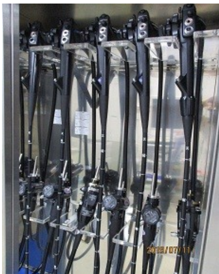
上部・下部・十二指腸・経鼻用内視鏡