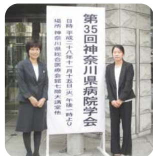
平成28年11月25日 神奈川県総合医療会館

院内感染の原因の殆どは「医療従事者の手」とされていると言われています。当病棟では、一昨年のインフルエンザ院内感染をきっかけに、二年間にわたり手指衛生（手洗いや手指消毒）の改善に取り組みました。スタッフ全員が手指消毒への意識を高め実施できたことは、患者様の安全で安心な入院生活を守ることにつながったと考えます。今後も継続的に取り組み、院内感染予防に努めていきたいと思ひます。