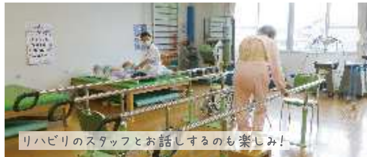
リハビリのスタッフとお話しするのも楽しみ！