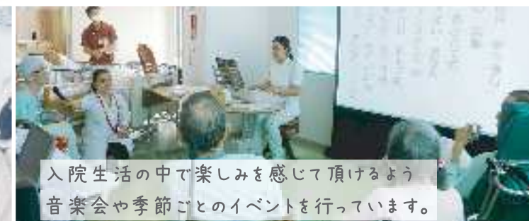
入院生活の中で楽しみを感じて頂けるよう音楽会や季節ごとのイベントを行っています。