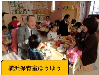
横浜保育室ほうゆう