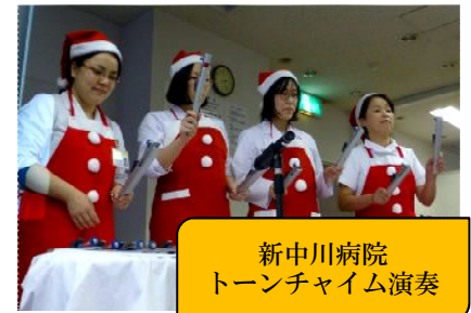
新中川病院 トーンチャイム演奏