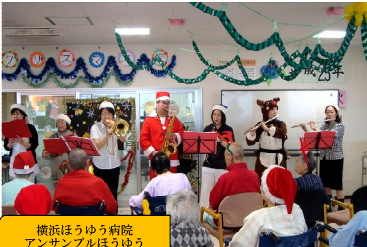
横浜ほうゆう病院 アンサンブルほうゆう