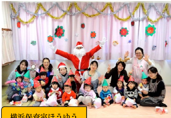
横浜保育室ほうゆう