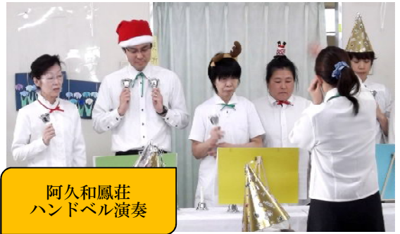
阿久和鳳荘 ハンドベル演奏

この時期恒例のクリスマス会が各施設で行われました。クリスマス会の雰囲気を楽しんで頂こうと、演奏や踊りをスタッフ一丸となって練習し、その成果を発表しました。サンタクロースの訪問もあり、盛況となりました。