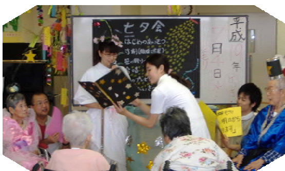
劇 「彦星・織姫ものがたり」