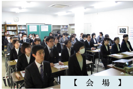
【 会 場 】