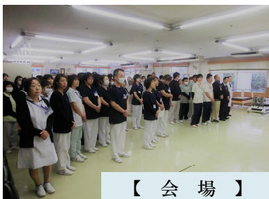
【 会 場 】