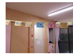
すみれ・たんぽぽぐみ

畑のおじさんがたくさんの苗を植えてくださいました。トマト・ナス・きゅうり・ゴーヤ・冬瓜・モロッコいんげん・玉ねぎ・にんじん。成長する様子を観察していきたいと思えます。