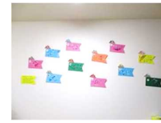
ちゅうりっぷぐみ